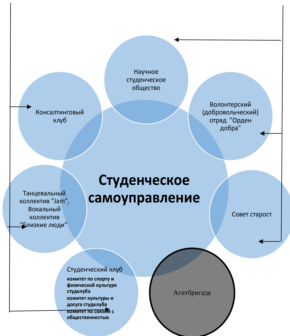
Рисунок 6.1 - Схема взаимодействия студенческих объединений в Алтайском филиале Финуниверситета

В отчетном учебном году в филиале продолжало свою деятельность волонтерское движение. Волонтерский (добровольческий) отряд «Орден добра» успешно реализует добровольческую деятельность по таким направлениям, как спорт и здоровый образ жизни, милосердие, творчество, экология, патриотическое воспитание.