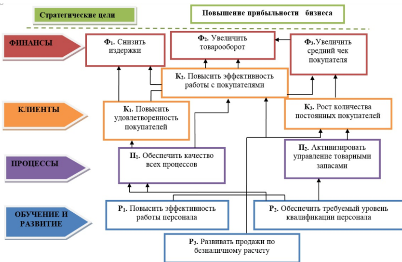
Стратегическая карта ООО «Розница К-1»

Далее устанавливается взаимосвязь между элементами стратегической цели и ключевыми показателями (рис.).